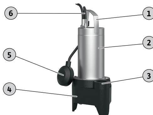
Fig. 1: Prehľad

Ponorné motorové čerpadlo na pevnú a mobilnú inštaláciu do mokrého prostredia v prerušovanej prevádzke.