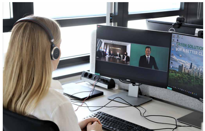
Коллеги из Wilopark также следили за цифровым мероприятием по случаю открытия

Группа Wilo — производитель насосов и систем насосов, предназначенных для оборудования зданий и сооружений, водного хозяйства и промышленности. Сегодня в компании заняты около восьми тысяч сотрудников в разных странах мира.