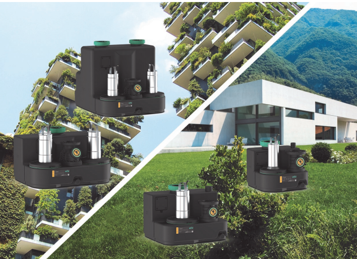
Wilo-Drainlift SANI S, M, L, XL Cliquez sur l'image pour en savoir plus