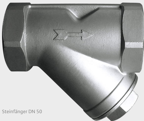
Steinfänger DN 50