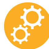
Extension de garantie