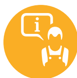
Mise en service

OPTEZ POUR LA SÉRÉNITÉ ET UNE PLUS GRANDE SÉCURITÉ EN SÉLECTIONNANT L'OFFRE DE SERVICES QUI VOUS CONVIENT