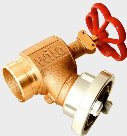
Schlauchanschlussventil WILO IndustrieSysteme