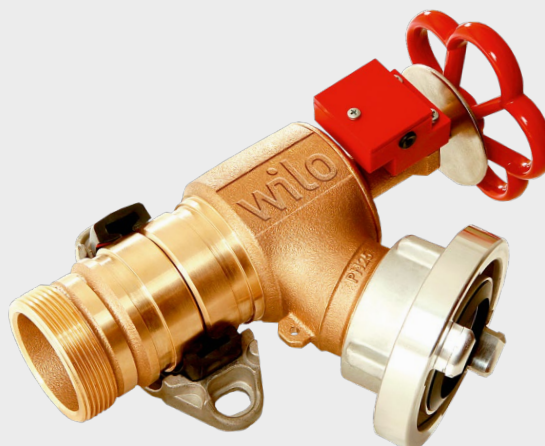
Schlauchanschlussventil optional mit Grenztaster und Anschlussstück