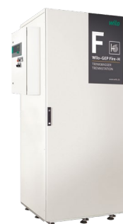
Trinkwasser-Trennstation von WILO IndustrieSysteme

Bei WILO IndustrieSysteme wird diese Herausforderung durch ein Umluftkühlgerät gelöst, welches die notwendige Kühlleistung durch das sichere Löschwasser realisiert. Stellt sich z. B. durch Betrieb der Löschwasseranlage eine kritische Raumtemperatur im Aufstellungsraum ein, öffnet eine Zusatzarmatur ① und die automatische Umluftkühlung wird zugeschaltet. Das als Kühlmedium verwendete Betriebswasser wird über einen bauseitigen Siphon in das Kanalnetz abgeschlagen. Ein wöchentlicher Funktionstest gewährleistet den Betrieb der Umluftkühlung im Einsatzfall.