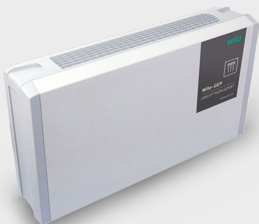
Umluftkühlgerät WILO IndustrieSysteme